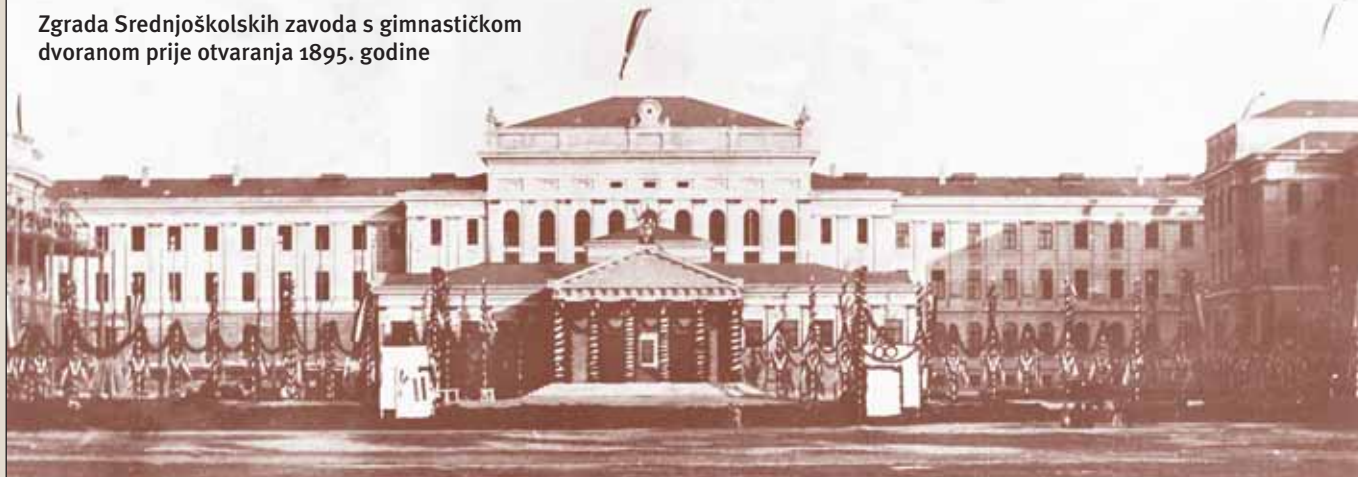
Zgrada Srednjoškolskih zavoda s gimnastičkom dvoranom prije otvaranja 1895. godine

Takva karakterizacija iz pera njegovih suvremenika uvelike je utjecala na nerazumijevanje i neprihvatanje modernih i vizionarskih poteza koje Kršnjavi vuče u području tjelovježbe i nastave TZK-a u Hrvatskoj devedesetih godina 19. stoljeća.